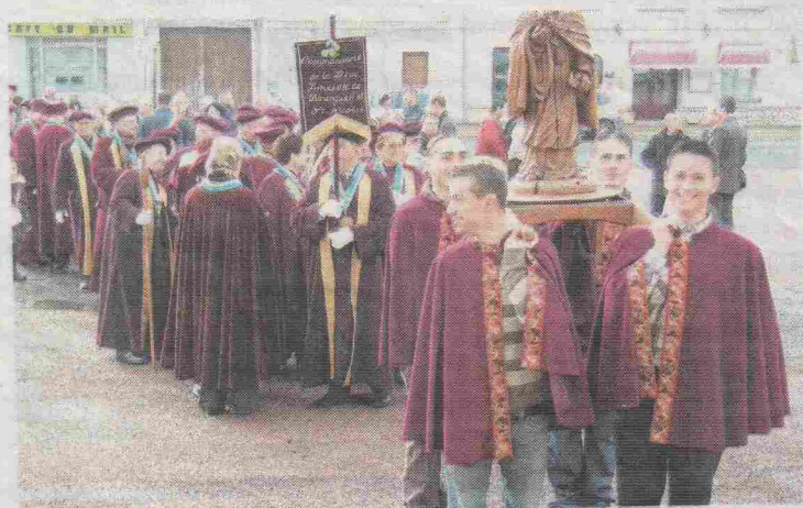
Quatre jeunes vignerons ont transporté saint Vincent de lieu en lieu.